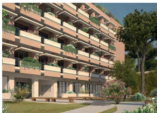
Domus Aventino, Piazza Albania, Roma