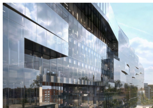
Nuova sede BNL, Roma Tiburtina

Bnp Paribas Real estate è main sponsor del progetto Roma 20-25