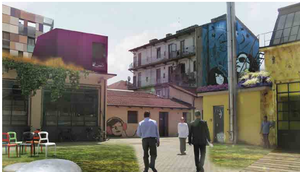
Fig.2 ToMake – masterplan della Variante 200, Studio TRA, Immagine di progetto 2. Torino, 2012. © TRA

può essere in grado di assecondare la compresenza di usi e di utenti attraverso uno spazio accessibile a tutti e semplice anche in termini tecnici, in questo vi è il grande compito dell'architettura. E' necessario ricominciare a studiare, ad esempio, delle pavimentazioni, degli spazi resistenti, resilienti, durevoli che richiedono poca manutenzione, croce dello spazio pubblico iperdecorato degli anni '80: pensiline da verniciare, cubetti in porfido da rimettere ogni volta al loro posto, cestini da raddrizzare. Sono bellissime quelle infilate di paletti in acciaio inox che sono state realizzate in molte città italiane, basta che se ne urti uno, che immediatamente lo spazio appare degradato, probabilmente quella non è una buona soluzione, quindi vedo una dimensione tecnica dello spazio pubblico che appartiene completamente all'architettura, e che deve però accettare di essere tecnica e non espressiva. Lo spazio pubblico non è il luogo dove l'architetto è chiamato ad esprimere le proprie personali idiosincrasie, sono invece luoghi dove è chiamato a dare forma e tecnica, a risolvere tecnicamente il problema di uno spazio accogliente, resistente, al fine di ottenere una sorta di lavagna dove poi generazioni, popolazioni e gruppi possano scrivere i loro testi, cancellarli e riscriverli nuovamente, senza che la cornice o il quadro cambi.